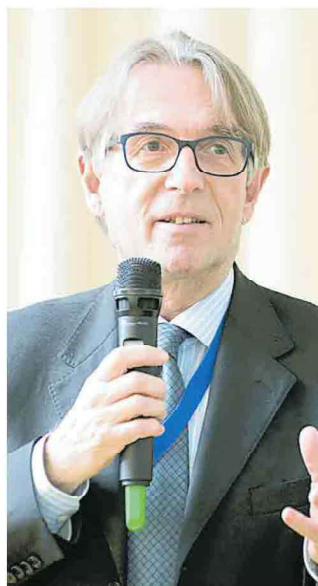
PAOLO VIDALI PRESIDENTE DELLA FONDAZIONE DEL TEATRO NUOVO GIOVANNI DA UDINE

Attore, regista e organizzatore di festival, dal 2019 è direttore artistico dell'Accademia Ludwig